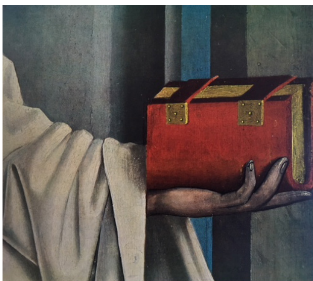
Conrad Witz - Saint Barthélemy, détail. Volet droit du Retable du Miroir du Salut - 1435. Bâle, Musée des Beaux-Arts.

(condamnation des enseignements d'Abélard au Synode provincial de Sens en 1140) ou sont tournées en dérision dans la littérature vernaculaire (Henri d'Andeli, Bataille des sept arts ). Simultanément, illustrant le phénomène qu'E. Panofsky a nommé la « forme formatrice des habitudes », la littérature en langue romane se trouve, pour diverses raisons, investie par ces nouveaux modes de penser et de raisonner, soit qu'elle cherche à divulguer auprès du plus grand nombre des connaissances jusque-là réservées aux clercs, soit qu'elle incorpore à son insu ces nouveaux modèles de pensée. Ce sont les causes, les modalités et les enjeux de tels transferts que ce colloque se propose d'étudier, en mettant au jour les marqueurs et les circuits de diffusion qui attestent de la présence de la pensée scolastique dans certaines œuvres littéraires, que celles-ci s'ouvrent à elle ( Le Roman de la Rose en est l'exemple le plus célèbre), la mettent en fiction ou la récuse.